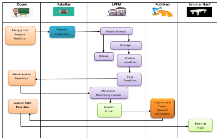
Gambar 1. Alur Pelaksanaan Penelitian Kepada Masyarakat